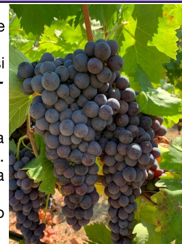
Ciliegiolo a Sestri Levante

MUFFA GRIGIA/BOTRITE - il clima della settimana con elevate temperature e assenza di piogge non ha favorito il patogeno; non si consigliano quindi interventi, da valutare solo in caso di cambiamento delle condizioni meteo.