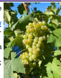
Foto: Vermentino a Riomaggiore

MUFFA GRIGIA/BOTRITE - il clima della settimana con elevate temperature e assenza di piogge non ha favorito il patogeno; non si consigliano quindi interventi, da valutare solo in caso di cambiamento delle condizioni meteo.