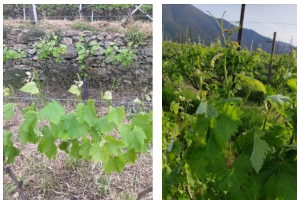
Lumassina a Noli a sx e Vermentino ad Albenga a dx

La scala fenologica BBCH è una scala internazionale di riferimento che è ripartita, per ogni specie vegetale, in 10 stadi principali: dal germogliamento/ripresa vegetativa alla fine del ciclo vegeto produttivo della specie in considerazione. Per maggiori informazioni sulla scala fenologica BBCH vite http://bit.ly/BBCH_Vite