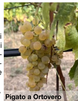
Pigato a Ortovero

E' possibile visualizzare l'andamento delle catture di tignoletta e tignola rigata aggiornate al 2 settembre, ed i riferimenti alla scheda tecnica al link: https://tinyurl.com/RLcattureSV .