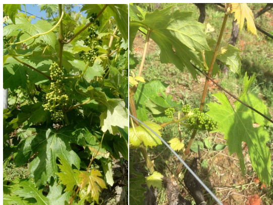
Rossese a Soldano (sinistra) e a Dolceacqua (destra)