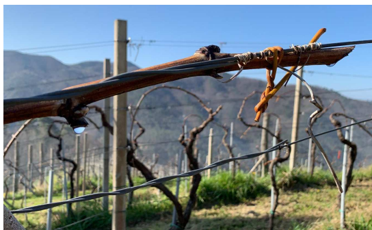
Vermentino nell'entroterra con segni di "pianto".

Questa settimana sono iniziati i rilievi puntuali nella rete provinciale. Complessivamente, soprattutto nelle zone di entroterra, la fase prevalente è ancora quella di gemma cotonosa anche se, soprattutto in costa e nelle zone più soleggiate dell'entroterra, in un numero crescente di piante sono visibili le punte verdi, segno di un prossimo inizio di germogliamento.