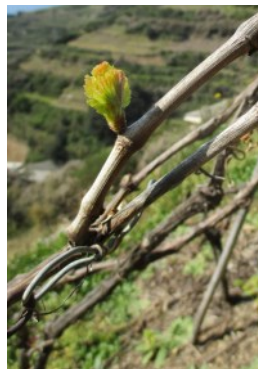
Foto : Apertura gemma e Foglie distese con i primi grappolini visibili

In assenza di rilievi di campo è stato utilizzato il modello di simulazione fenologica in uso al CAAR e si possono ipotizzare situazioni variabili tra i vitigni e le diverse aree, comprese prevalentemente tra la fase di prima foglia distesa e grappolini visibili ; per alcuni vitigni a bacca bianca il modello mostra gemme ancora in fase di apertura , al contrario per alcuni vitigni a bacca rossa della costa si possono rilevare i primi grappolini separati .